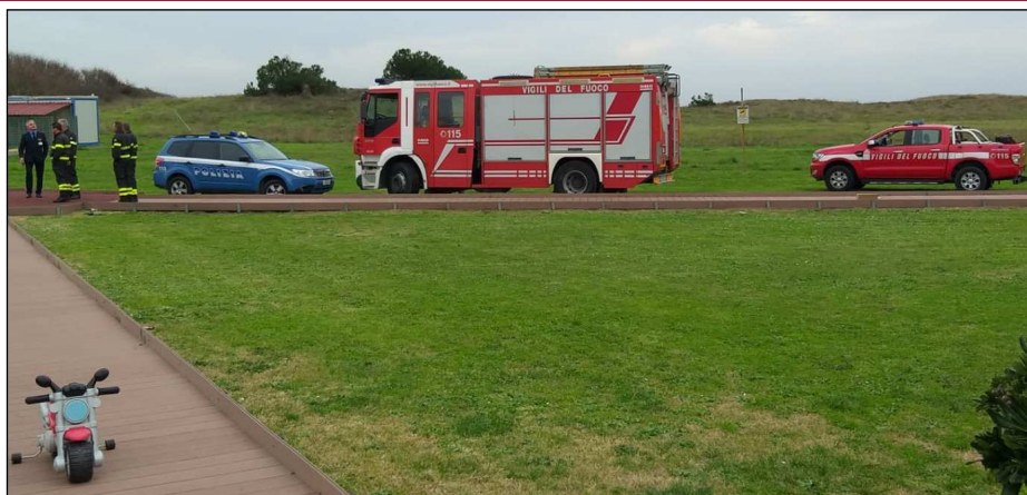
Sopra una foto della visita ADMI all'Ospedale Bambino Gesù - 2019 - insieme a uomini e mezzi dei Vigili del Fuoco e della Polizia di Stato

Viene sostituito l'incontro-conforto tra genitori e volontari, con relativa distribuzione di doni ai piccoli ricoverati, con la donazione di un sistema di intrattenimento TV in streaming per i reparti a loro dedicati.