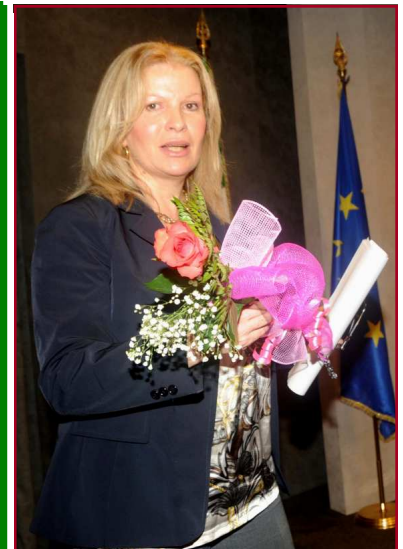
Sopra il Prefetto Laura Lega durante un intervento ad evento ADMI sul tema "Stress lavoro correlato"

Rinnoviamo la grande stima nei confronti del Capo del Corpo Nazionale dei VV. F. con cui abbiamo avuto molte occasioni d'incontro per costruttivi scambi di pensiero e siamo fieri di averlo avuto come gradito ospite in diversi convegni ADMI.