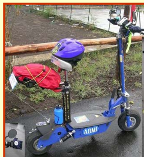
Due mezzi A.D.M.I. Protezione Civile di Catania che operano in Abruzzo.