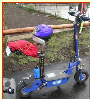
Due mezzi A.D.M.I. Protezione Civile di Catania che operano in Abruzzo.